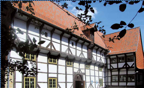
Hornemann Kolleg 12 – Der Weg in die Vitrine

Dr. Andrea Nicklisch, Roemer- und Pelizaeus-Museum Hildesheim In der Kürze liegt manchmal die Würze. Ausstellungsplanung am Beispiel der Ausstellung „Mit 80 Objekten um die Welt“