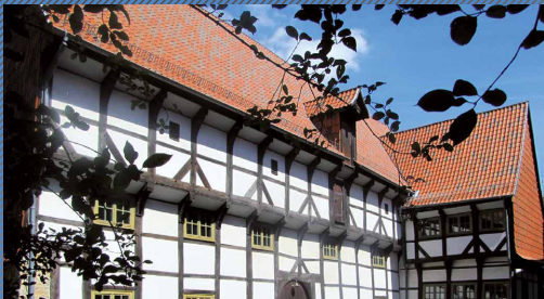
Hornemann Kolleg 12 – Der Weg in die Vitrine